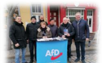
07.02.2024: Am Infostand in Arnstadt