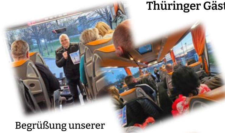
Begrüßung unserer Gäste zur ersten Besucherfahrt 2024.