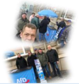
14.02.2024: Am Infostand in Ohrdruf