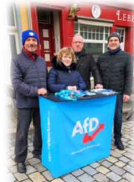
23.01.2024 am Infostand in Arnstadt