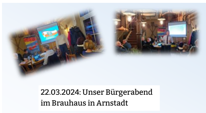
22.03.2024: Unser Bürgerabend im Brauhaus in Arnstadt