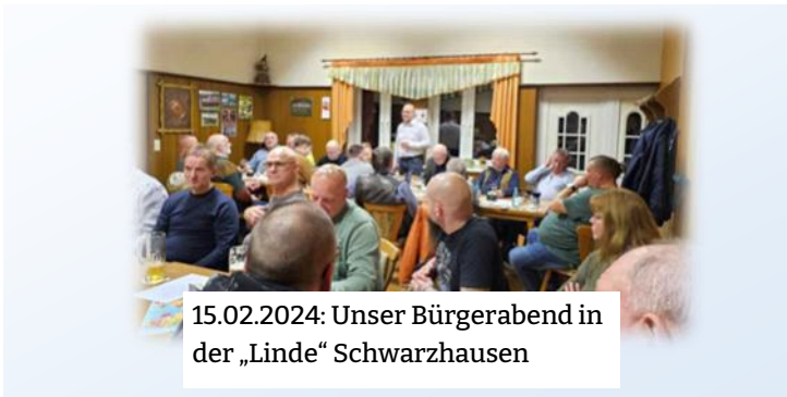
15.02.2024: Unser Bürgerabend in der „Linde“ Schwarzhausen