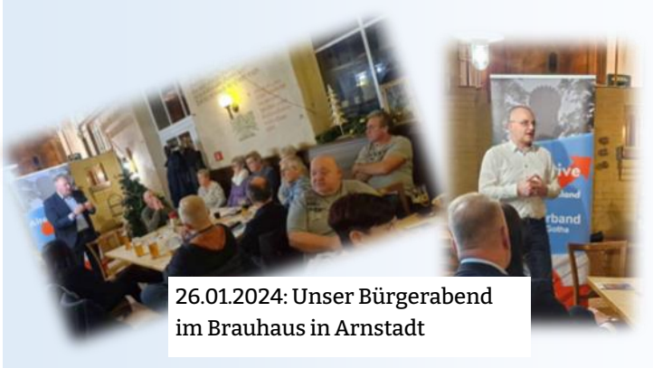
26.01.2024: Unser Bürgerabend im Brauhaus in Arnstadt

+++ Eindrücke von unseren Infoständen im Kreisverbandsgebiet +++