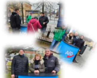
10.02.2024: Am Doppel-Infostand in Ilmenau