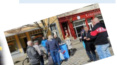
26.03.2024 : Am Infostand in Arnstadt