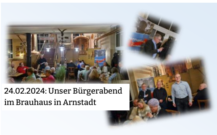
24.02.2024: Unser Bürgerabend im Brauhaus in Arnstadt